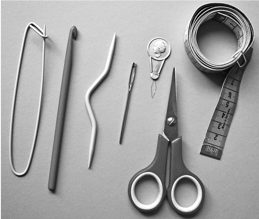
Abbildung 1.3: Von links: Maschenraffer, Häkelnadel und Zopfnaedel, Wollnaedel, Einfädelhilfe, Schere und Maßband

von Zopfmustern gedacht sind. Um beim Rundstricken den Beginn der Runde oder den Anfang eines Musters zu markieren, kann man Maschenmarkierer verwenden. Sie können aber auch eine einfache Fadenschlaufe aus andersfarbigem Garn verwenden oder im Notfall eine Büroklammer, um bestimmte Stellen Ihres Strickstücks kenntlich zu machen.