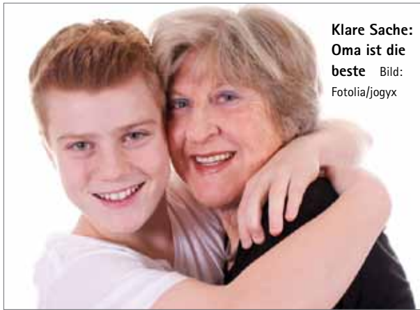
Klare Sache: Oma ist die beste

Angeblieh brauchte der Oma-Tag in Deutschland 31 Jahre, ehe er 2012 Premiere feierte. Und wie so manche behaupten, hat ein Interview