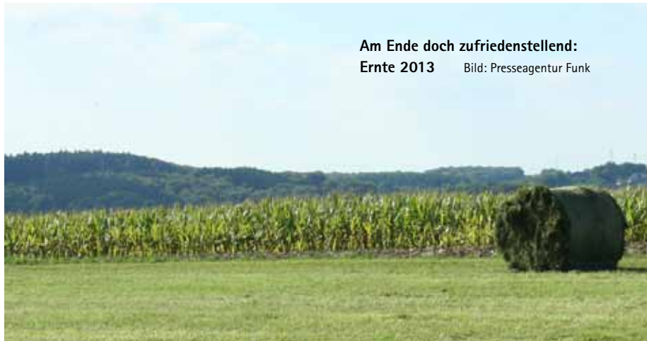
Am Ende doch zufriedenstellend: Ernte 2013

Die Wiesen seien zu alt geworden, enthielten dadurch