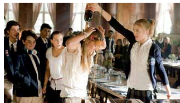
Britische Jungs zu Gast auf dem Lindenhof - das führt in „Hanni & Nanni 3“ unter anderem zum Zickenkrieg.