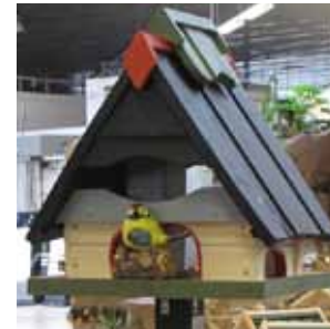
Große Auswahl im Baucenter: von der Vogel-Villa bis zum einfachen Unterschlupf

So umfasst die Ausstellung auch die unterschiedlichsten Häuser: vom einfachen Unterschlupf zum Aufhängen bis hin zur regelrechten Vogelvilla zum Aufstellen. Für die Speisekarte der Fly-in-Restaurants führen die Baucenter zudem ein großes Sortiment an Vogelfutter.