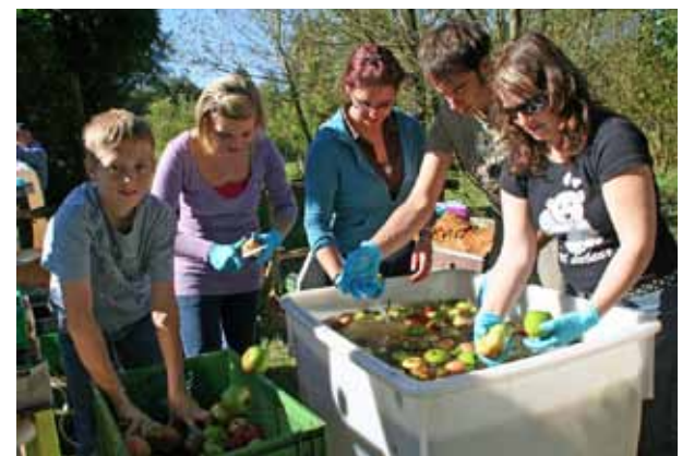
Beim Anual wird am Tag der Natur aus knackigen Äpfeln frischer Saft gepresst.