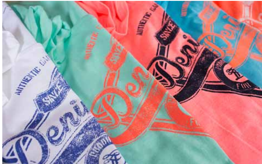
Viele Labels wie etwa Tom Tailor setzen mittlerweile verstärkt auf Mode aus nachhaltiger Produktion und verpflichten sich zur Einhaltung sozialer und ökologischer Standards.