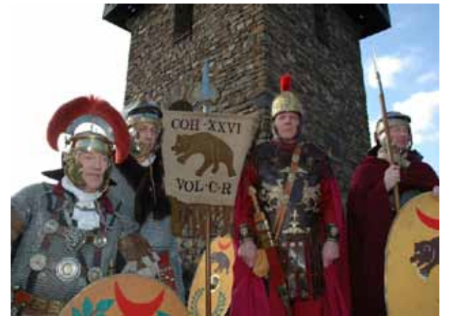
Prosit Caesar! Am Caput Limitis wird gefeiert wie es die alten Römer taten.