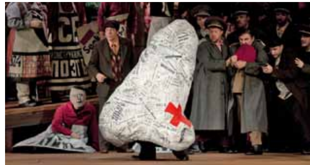
Unten: Die Nase, der eigentliche Hauptcharakter