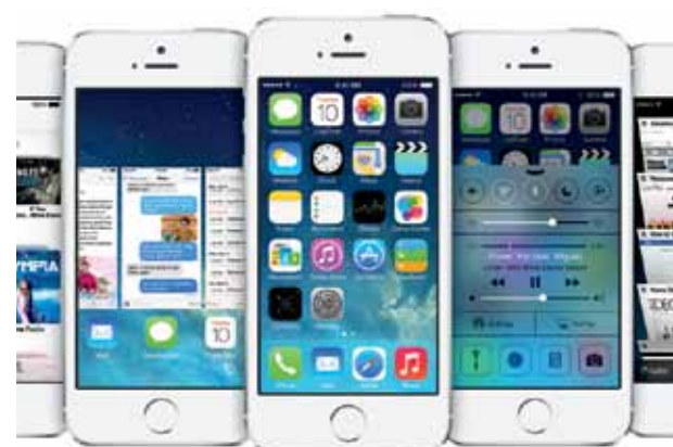
Apples iOS7: So manche neue Funktion offenbart sich erst auf den zweiten Blick.