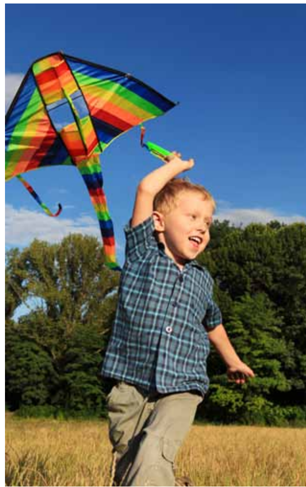
So ähnlich sahen wohl für die meisten die ersten Drachenflug-Erfahrungen aus.

In ganze andere Dimensionen stoßen die Piloten sogenannter Kiteschirme und Lenkmatten vor. Weil die Kräfte, die sich bei einem solchen Drachentyp entwickeln, sehr massiv sind, sollten diese Sportgeräte nur von erfahrenen Piloten gesteuert werden. Die Power-Kiter toben sich am Strand oder auf einer Wiese im Buggy (Buggy-Kiting), auf dem Wasser auf einem Surfbrett (Kite-Surfing) oder einem Segelboot (Kite-Sailing), auf Rollschuhen (Kite-Skating) oder in Gebirgen (Kite-Jumping) beziehungsweise im Schnee (Snow-Kiting) nach Herzenslust aus.