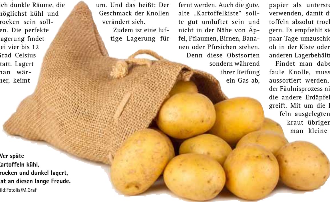
Wer späte Kartoffeln kühl, trocken und dunkel lagert, hat an diesen lange Freude.

Die während der Einkeller-Aktion der Vorteil-Center angebotenen Mengen reichen bis hin zu 20 kg-Säcken, die zum aktuellen Tagespreis gehandelt werden. Die Sorte „Cilena“ zählt zur Gruppe der festkochenden Kartoffeln. Sie wird wegen ihrer schönen, birnenartigen Form, der ausgeprägten gelben Fleischfarbe und ihrer guten Konsistenz mit feinem, mildem Geschmack als Delikatess-Sorte bewertet und geschätzt.