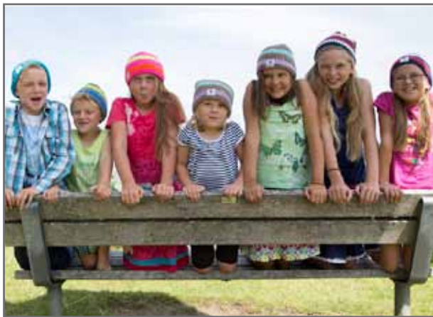
Zu jedem Topf gibt's den passenden Deckel, zu jedem Kopf den passenden Style