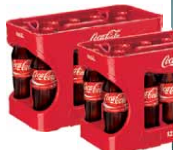
* Der anfallende Kisten- und Flaschenpfand ist zu entrichten.