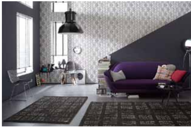
Wer einem Raum seine ganz persönliche Note mit Tapeten verleihen möchte, sollte einige Spielregeln beachten.

Dabei spielen vermehrt verschiedene Strukturen eine Rolle: Auf glänzenden Flächen zeigt sich das Licht deutlicher. Mit diesem Effekt können bestimmte Teile eines Zimmers stärker betont werden, während die anderen Wände den perfekten Hintergrund für auffällige Möbel oder Wohnaccessoires