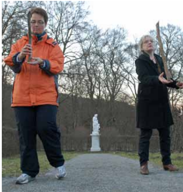
Beim Gesundheitswandern werden kurze Laufstrecken mit Balanceübungen kombiniert.

Die vom DWV entwickelten Gesundheitswanderungen werden von eigens dafür zertifizierten Gesundheitswanderführern angeboten – seit 2009 haben sich 180 solcher Coa-