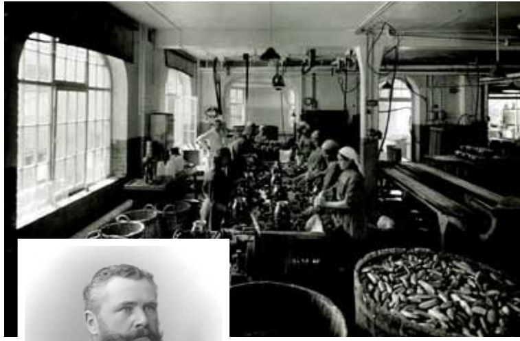
Glas und in der Tube – angeboten. Wenig später schlug die Geburtsstunde des weltweit ersten pasteurisierten Sauerkrauts. Dr. Richard

Unter der neuen Marke wurde nun unter anderem auch „Tomatenwürze“ – im