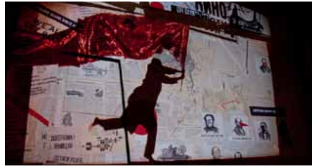
Oben: Schostakowitschs Erstling – klassische Rarität, neu interpretiert

Die Folgen sind Prügeleien, Missverständnisse, ja selbst missverständene Heiratsanträge – bis die Nase wieder auf ihre ursprüngliche Größe schrumpft.