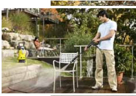
Gartenarbeit leicht gemacht: Mit den richtigen Hilfsmitteln geht es schnell.

Das abgeschnittene Grün wie auch heruntergefallenes Laub lässt sich anschließend ohne nennenswerte Kraftanstrengung von Wegen und