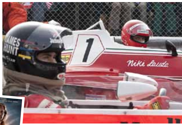
Das Rennen kann beginnen – James Hunt (Chris Hemsworth) gegen Niki Lauda (Daniel Brühl)

Lauda (Daniel Brühl) ehrgeizig an seiner Formel-1-Karriere feilt, stürzt sich Naturtalent James Hunt (Chris Hemsworth) ins glamouröse Jetset-Leben. Ihre Rivalitäten tragen die beiden Ausnahmefahrer nicht nur in spektakulären Rennen aus, sondern auch in heftigen Wortgefechten jenseits der Rennbahn. Immer wieder heißt es: Hunt gegen Lauda – der Hunkstar und Playboy der Formel 1, verheiratet mit dem erfolgreichsten Model seiner Generation, Suzy Miller (Olivia Wilde), gegen den messerscharfen Strategen und Perfektionisten.