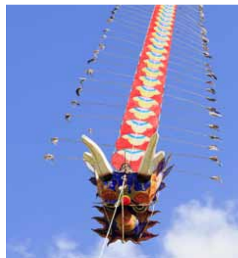
In Asien wurden Drachen vor 2000 Jahren auch zur Abschreckung benutzt.

die Wirkung elektrischer Blitze. Zu Beginn des 20. Jahrhunderts entwickelte der Amerikaner Samuel Franklin Cody mit seinem „man lifting“-System sogar einen Drachen, der Menschen in die Lüfte heben sollte. Während der Weltkriege