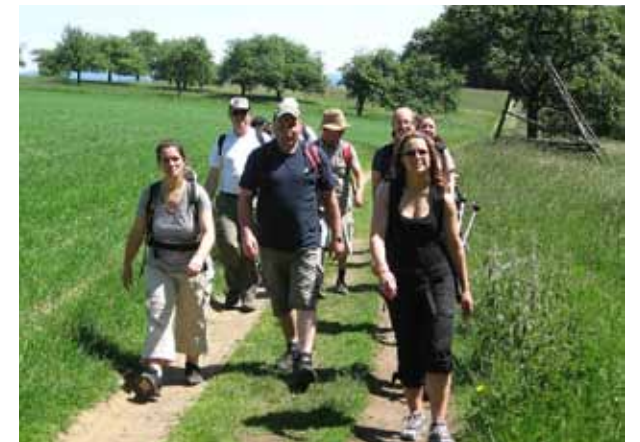
Neben tollen Wanderstrecken bietet „steigRhein“ auch kulturelle Höhepunkte und kulinarische Leckerbissen.