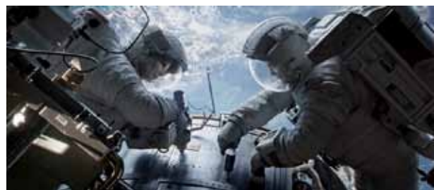
Ins All geschossen: Bullock und Clooney

Tschaikowskys Eugen Onegin (MET live): Sa. 19.00; Rush – Alles für den Sieg: 15.00, 17.30 (außer Sa.), 20.00 (außer Sa.), Sa. auch 17.45, 20.15, 22.45; Gravity (3D): 17.45, 20.00, Sa. auch 22.30; Turbo – Kleine Schnecke, großer Traum: 14.45, 16.45, 18.45 (alle 3D), 12.00, 14.00, 16.00 (alle 2D); Alles eine Frage der Zeit („Cine5 Lady“-Preview): Mi. 20.00; Kinohr-hase und Zweiohrküken: 12.00, 14.30 (alle 2D), 16.00 (3D); V8 – Du willst der Beste sein: 12.00, 14.00, 16.00; 2 Guns: 20.45, Sa. auch 22.45; Prakti.com: 18.00, 20.15, Sa. auch 22.45; White House Down: So./Mo. 20.15; Wir sind die Millers: 18.00 (außer Sa. + Di.); Planes: 12.00; Die Schlümpfe 2: 12.00; Con-juring – Die Heimsuchung (Best of): Di. 18.00, 20.15; Weitere Informationen und Buchung: www.cine-five.de