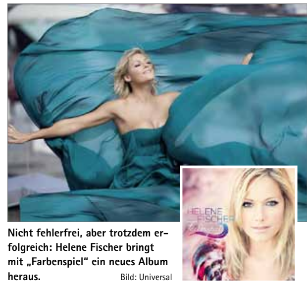
Nicht fehlerfrei, aber trotzdem erfolgreich: Helene Fischer bringt mit „Farbenspiel“ ein neues Album heraus.