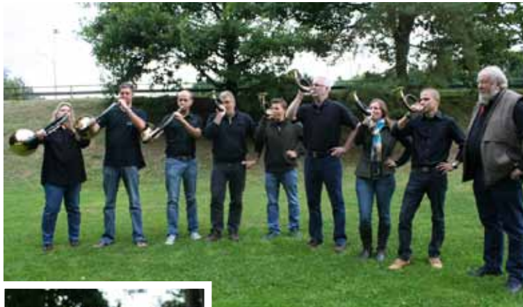
Oben: Die Wäller Jagdhornfreunde wurden vor über einem Jahr gegründet.

„Die Hörner haben einen sehr geringen Tonumfang, gerade mal fünf Naturtöne, das macht das Erlernen der Instrumente relativ leicht“, gibt Stüber zu verstehen. Schon Kinder ab zehn Jahren könnten schnell das Jagdhornblasen erlernen. Auch der Großteil der Gruppe hatte vor über einem Jahr bei null angefangen, mittlerweile beherrschen die „Wäller Jagdhornfreunde“ viele