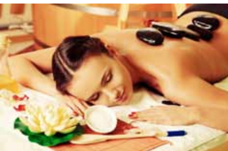
München hat mehr als die Wiesn und den FCB. Auch Wellness-Reisende kommen hier auf ihre Kosten.

In kleinen, zentral-gelegenen Wellness-Oasen wie Or-