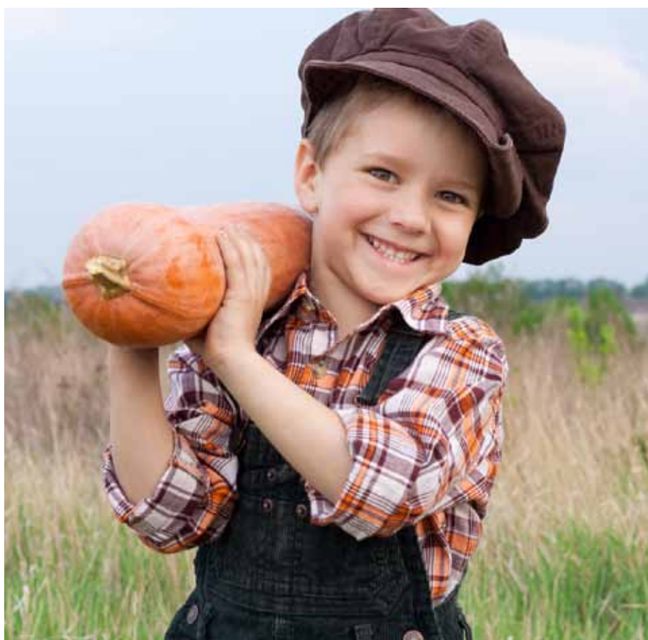
Kolumbus sei dank – der Entdecker brachte einst den Kürbis mit nach Europa.

Für Kindergartenkinder in Neustadt ticken die Uhren etwas anders. Hier bestimmen die Kastanien im Wiedtal den Herbstanfang. In Unkel oder Leutesdorf sind es da eher die reifen Trauben im Winter, die die dritte Jahreszeit signalisieren. Stichwort Kastanien: Zum 77. Mal startet das Süßwaren-Unternehmen Haribo in Bonn Ende Oktober seine Tauschaktion: Zehn Kilo Kastanien oder fünf Kilo Eicheln gegen ein Kilo Haribo. Das Event sorgte in den vergangenen Jahren zeitweise für chaotische Verkehrsverhältnisse und lange Schlangen vor dem Firmengelände in Bad Godesberg. Das dürfte am 24. und 25. Oktober in diesem Jahr nicht anders sein. Der September trug mal